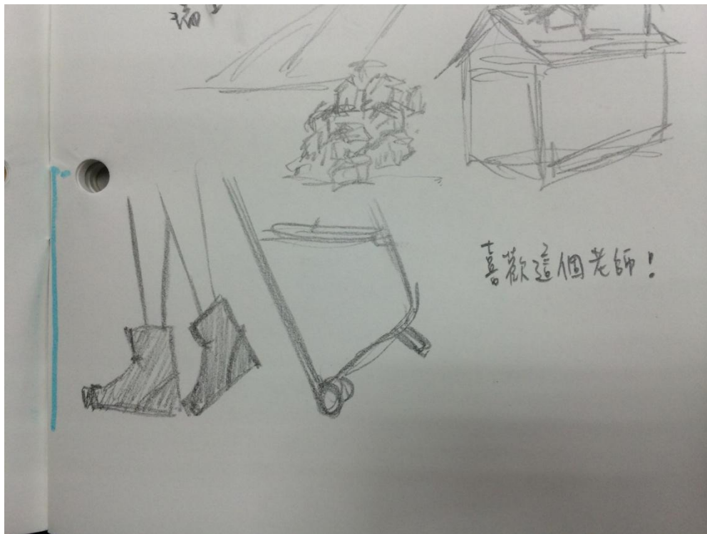
企管 1 孫同學