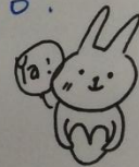
數學 3 葉同學

現在我終於瞭解：為何 各地有各地的建築特色。 扁扁的屋頂，尖尖的屋頂， 鮮豔的船，高腳的房子... 這些其實都人與環境一種 "友善"的相處方式而造就 許許多多有趣的在地文化。