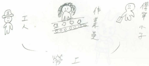
數學 1 林同學

其實全球化也不錯，統一的品牌能夠保障生薑的品質，而且仲冰也比較能夠找到對象，不怕對方會跑品。